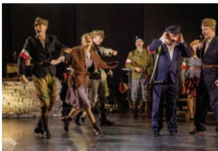
Kościuszki w Cygance Było pięknie !! Dziękujemy